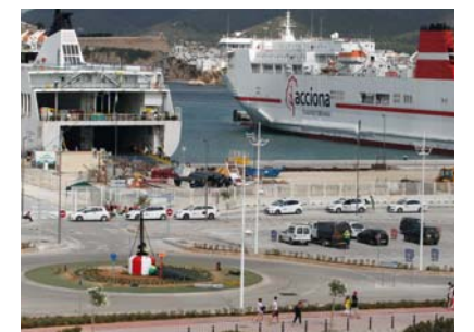
El material previamente adaptado para el viaje llega al puerto de Valencia en un camión de ACCIONA Logística. Sobre estas líneas, los ferries de Trasmediterranea en Ibiza. The material previously adapted for travel arrives at the port in Valencia in an ACCIONA Logística lorry. Above, the Trasmediterranea ferries in Ibiza.

Cada año, 1.500 toneladas de dióxido de carbono y unas 1.200 de oxígeno cruzan el mar rumbo a las Islas Baleares